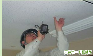
天井ボード張替え

店舗、オフィス、一戸建てからマンションまで、一部の内装工事から大規模改装にいたるまで、国内有名メーカーの材料を数多く取り揃えて幅広くお客様のご要望にお応えできる体制を実現しました。また、当社の工事はすべて新築住宅を数多く手掛けた経験豊かな優秀な職人が責任を持って施工しています。熟練の技術による美しい仕上がりをお約束します。